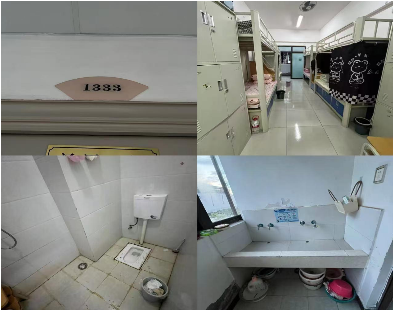
1419: 职教系24级老服302班 (辅导员: 杨继雄)