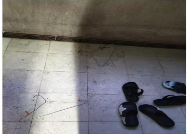
3403: 学前系24级早教301班 (辅导员: 赵莉)