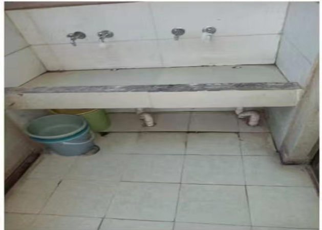
1126: 基教部22级315班 (辅导员: 李涛)