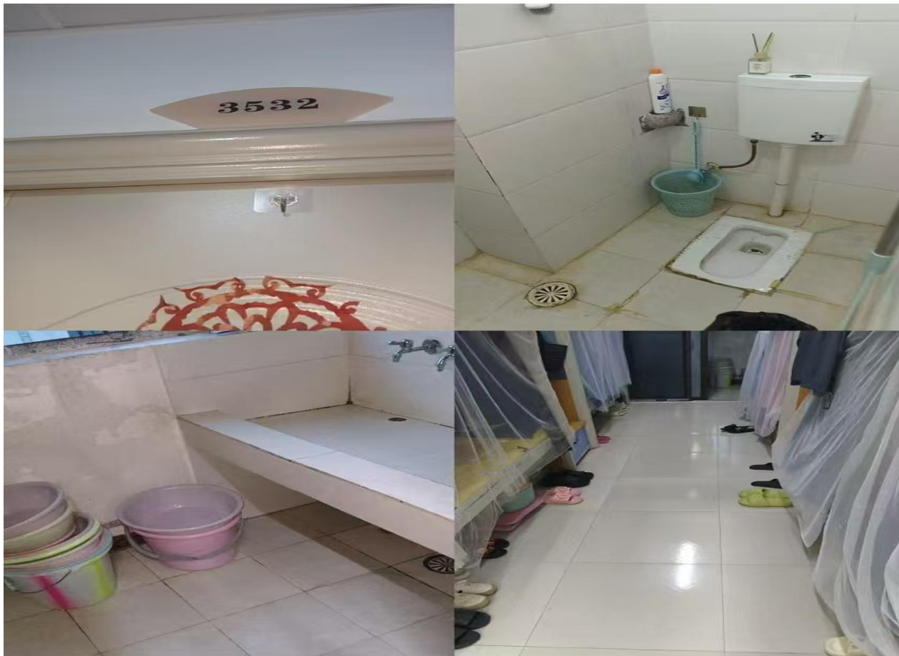
3627: 信息中心23级计算机302班 (辅导员: 陈芳霞)