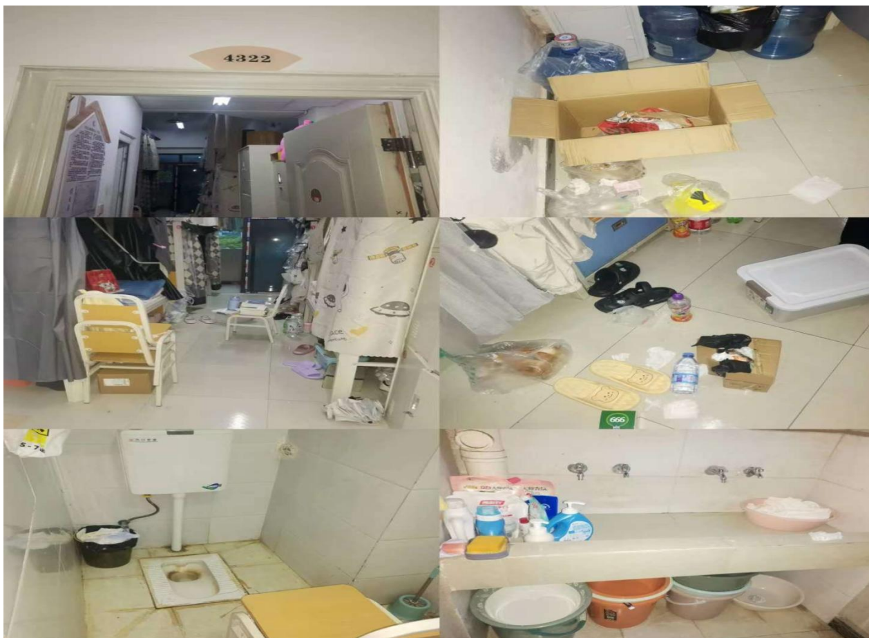
4223: 学前系24级早教302班 (辅导员: 赵莉)