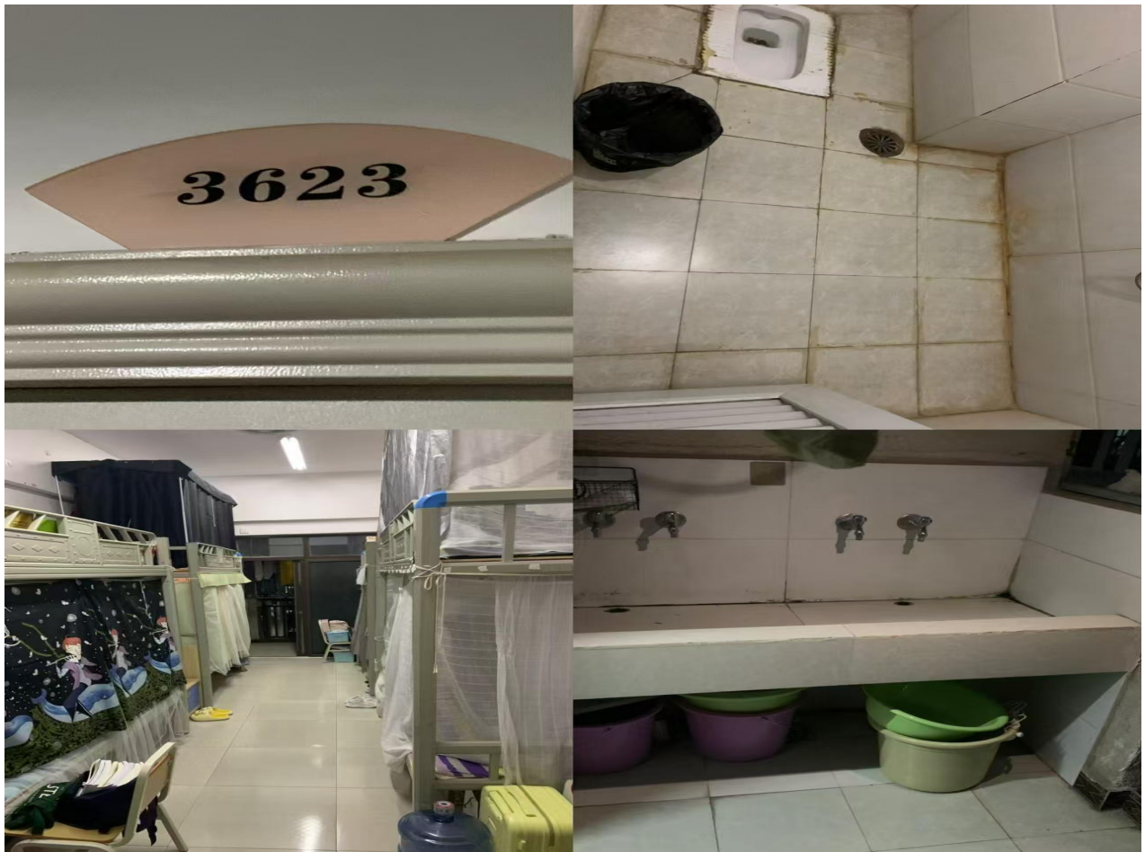
4120: 信息中心系24级计算机应用301班