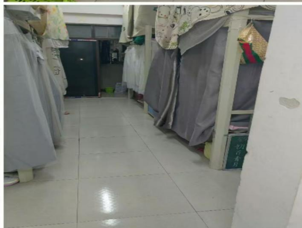
3109（男生）： 信息中心系24级计算机应用301班