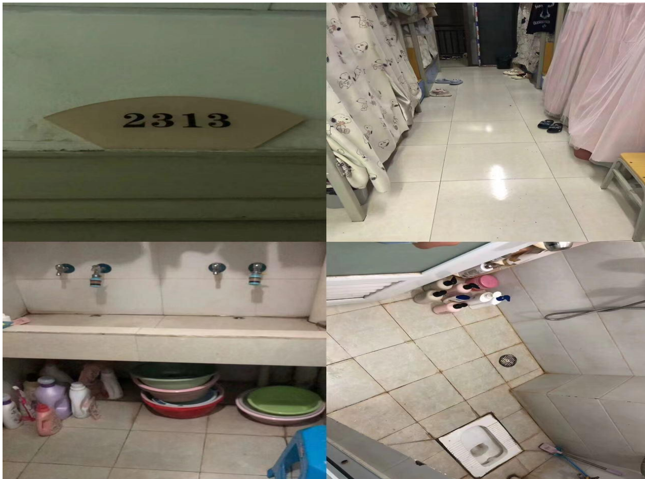
4502: 小教系21级304班 (辅导员: 刘海铭)