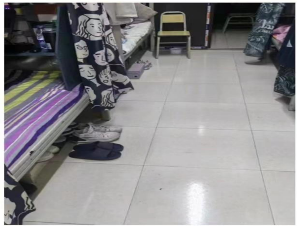
2614: 基教部22级学前501班 (辅导员: 黄潇芸)