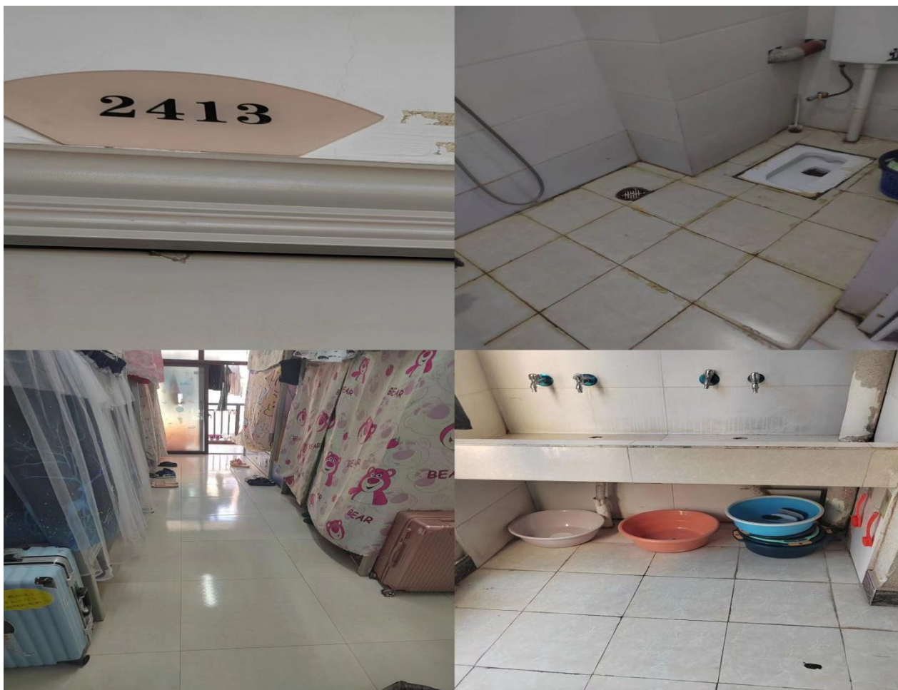
2127: 小教系23级304班 (辅导员: 张俊雅)