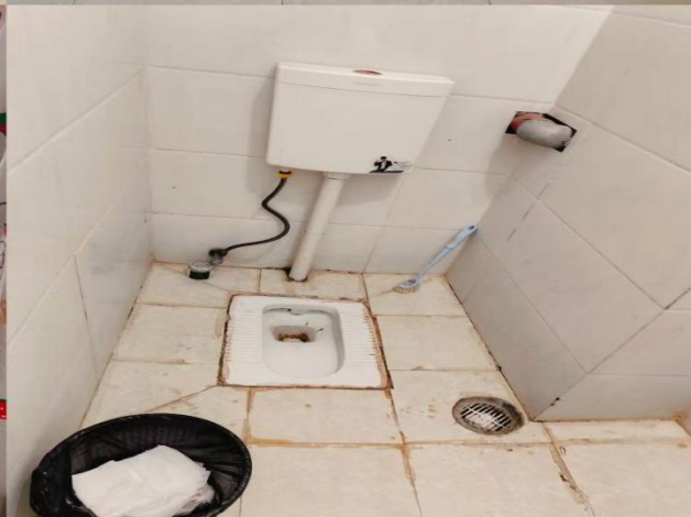
2436: 学前系23级306班 (辅导员: 吉皮利甲木)